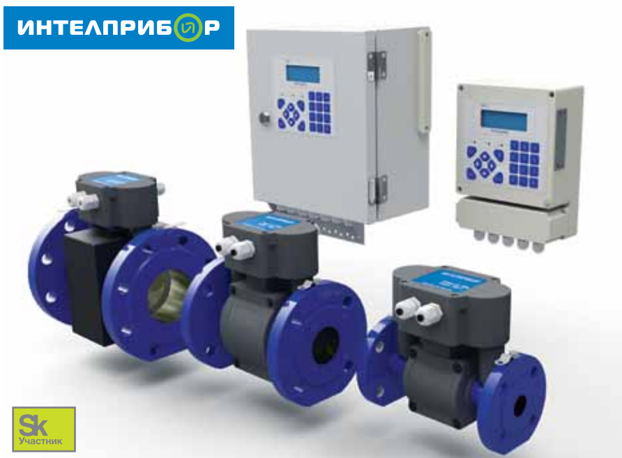
▲ Теплосчетчики компании «Интелприбор»